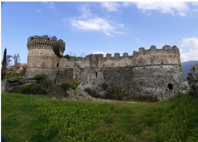
Castello Aragonese (1490)

Il territorio belvederese, si distingue per le sue peculiari caratteristiche; si tratta di una zona nella quale sono stati rinvenuti reperti archeologici dell'età del Bronzo e che si adagia su una delle principali vie istmiche di collegamento con la pianura sibaritica, antico sentiero di transito fin dai remoti tempi dell'ossidiana. I popoli che si sono in esso avvicendati, hanno lasciato segni duraturi nei contesti altocollinari, oltre che forti tracce nella lingua dialettale e nella toponomastica. Gli insediamenti delle località pedemontane, risentono di modelli di controllo del contado, di ascendenza sia feudale che improntata su modelli arabi. Brettii, Elleni, Romani, e poi Bizantini, Longobardi, Normanni, ed ancora Angioini, Aragonesi e Spagnoli, hanno lottato per il possesso di questo spicchio di bellezza, arricchendo la dimensione artistico-culturale ed anche quella gastronomica.