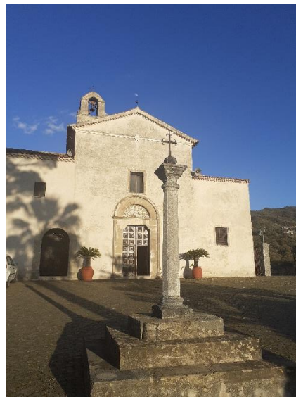
Convento San Daniele (1595)

- Ore 18:30 ritrovo dei partecipanti in Piazza Amellino (Centro Storico), per una visita al borgo di Belvedere Marittimo, della durata di circa 60 minuti. Si percorrerà un itinerario in cui si vedranno: